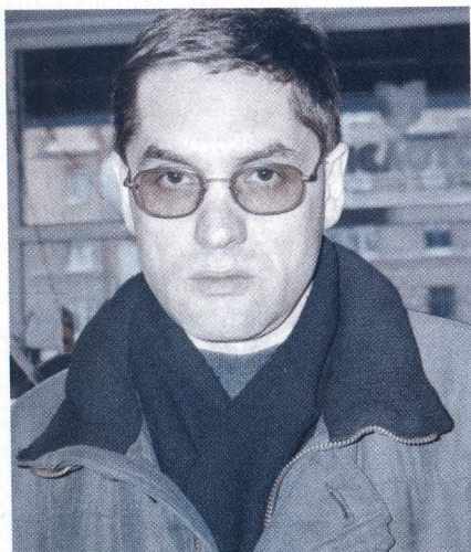
Автор идеи Кокоулин Дмитрий Данырович